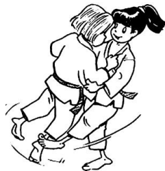
OKURI-ASHI-BARAI BALAYAGE DES DEUX PIEDS