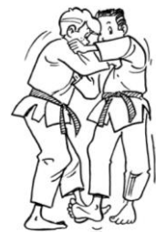
DE-ASHI-BARAI BALAYAGE DU PIED AVANCÉ