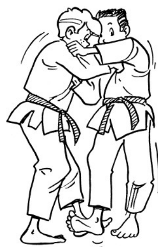
DE-ASHI-BARAI BALAYAGE DU PIED AVANCÉ