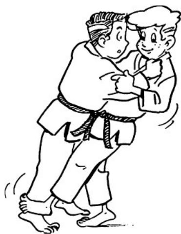
HARAI-TSURIKOMI-ASHI BALAYAGE DU PIED EN PÉCHANT