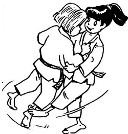
OKURI-ASHI-BARAI BALAYAGE DES DEUX PIEDS